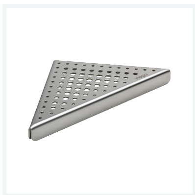
Advantix-Rost Visign EA2 Modell 4972.41