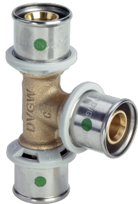
Sanfix P-T-Stück mit SC-Contur - Pressanschlüsse Modell 2118