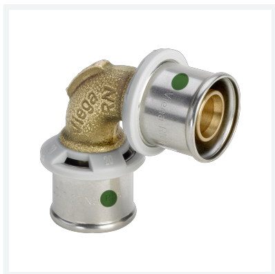
Sanfix P-Bogen 90° mit SC-Contur - Pressanschlüsse Modell 2116