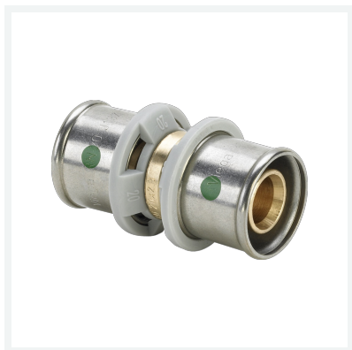
Sanfix P-Kupplung mit SC-Contur - Pressanschlüsse Modell 2115