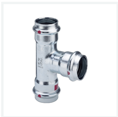
Prestabo-T-Stück mit SC-Contur Modell 1118 Artikel 558 796