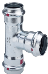
Prestabo-T-Stück mit SC-Contur - Pressanschlüsse Ausstattung Dichtelemente EPDM Modell 1118 Artikel 558 710