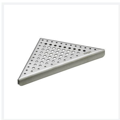
Advantix-Rost Visign EA2 Modell 4972.40