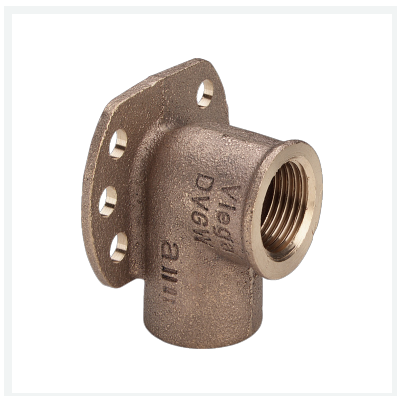
Wandscheibe Modell 94471G Artikel 106 393