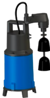
Sanisub ZPK 40 AV