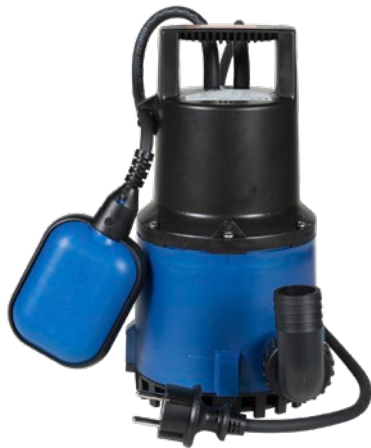
Sanisub ZPK 30 A

Die Sanisub ZPK ist eine in 3 Modellen erhältliche Schmutzwassertauchpumpe, die zur Förderung von Abwasser aus Garagen und Regenwasserschächten geeignet ist. Das Model 40 AV mit Kompaktschwimmer eignet sich ideal zum Einsatz in Schächten oder Tanks. Alle Modelle sind kurzzeitig gegen heißes Wasser von bis zu 90 °C resistent. Die Sanisub ZPK wird je nach Modell durch einen verstellbaren Schwimmer oder Kompaktschwimmer automatisch ausgelöst und kann Wasser bis zu 10 m Höhe und einer Korngröße von 10 bis 30 mm abpumpen. Alle Modelle werden mit einem 90°-Anschlussbogen DN 25 oder DN 32 (je nach Modell) und mit 10 m Netzkabel mit Stecker geliefert.