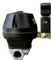
Automatische Abschlämmeinheit Modell JAE 20