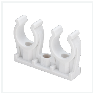
Rohrclip - doppelt Modell 94826C2